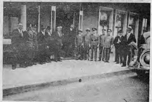
Gobernadores y comandantes de policía, posan para LA TRIBUNA después de la reunión celebrada ayer con el jefe del estado y su secretario de gobernación, en la que se convino como lo informamos en la presentación—acerca de la nueva Ley de licencias que comenzará a aplicarse a partir del 22 del mes en curso.