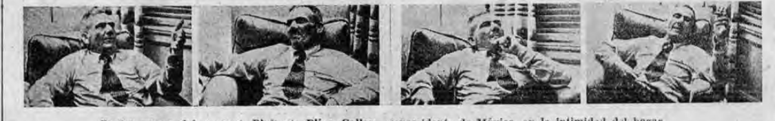
Cuatro poses del general Plutarco Elias Calles, expresidente de México, en la intimidad del hogar.

ASI DICE EL EX-PRESIDENTE DE MEXICO, GENERAL PLUTARCO ELIAS CALLES, AL HACER UN ANALISIS DE LA SITUACION INTERNACIONAL EN QUE CONDENA AS TENDENCIAS DE LAS DERECHAS Y DE LAS IZQUIERDAS EN EL MAGAZINE "TODAY" CUYA CIRCULACION FUE PROHIBIDA EN MEXICO, HABLA DE LOS MALES QUE TIENEN AGOBIADA A LA HUMANIDAD