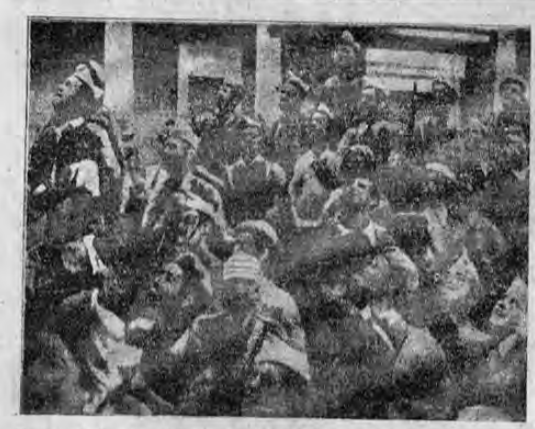
Grupo de bravos defensores del Alcázar de Toledo que escuchan, junto a los muros gloriosos de la ciudad la arenga de salutación que les hace el general Franco al día siguiente del rescate. No tiene las caras de estos hombres, muchos de ellos, demacrados, algunos barbados, que después de dos meses de luchar noche y día han podido abrazar a sus compañeros libertadores.