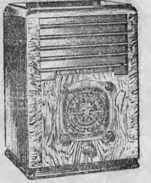
Model No. 6-S-128